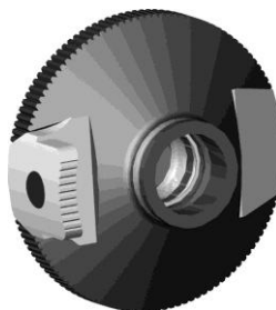
Bild 6: Rondelle für Farbfiltreinsatz an Irisblende zu Stgw 90 diverse Fabrikate