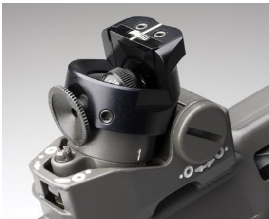
Bild 4: Excenter-Farbfilter mit Schiebekassette zu Stgw 90, Modell Grünig & Elmiger; Modell Wyss ähnlich